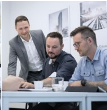
In fast allen Industrien zu Hause