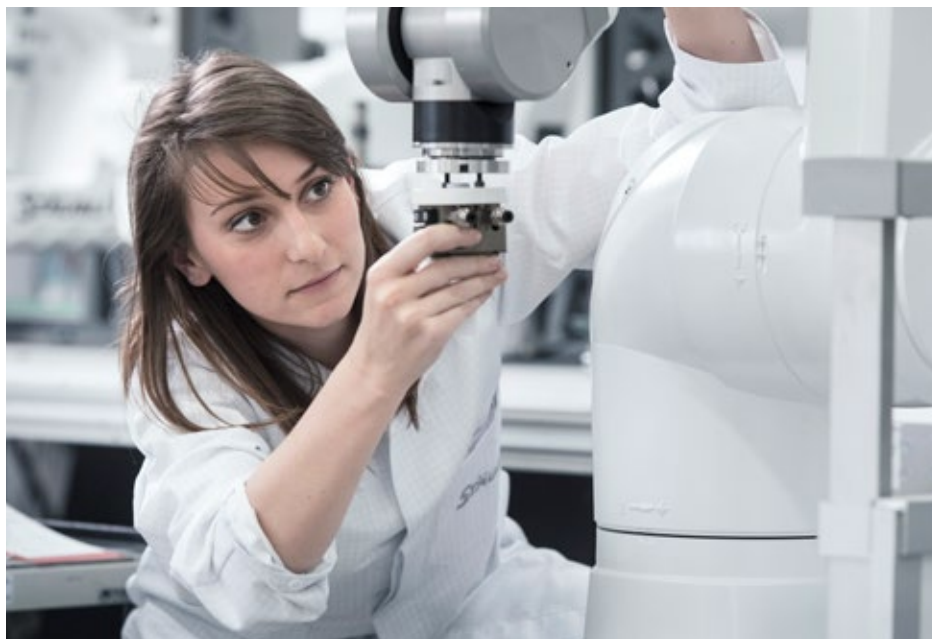
Einblicke gewinnen und Erfahrung sammeln bei einem internationalen Hightech-Konzern

Sie haben genug von der Theorie und möchten endlich Praxisluft schnuppern? Dann sind Sie bei Stäubli genau richtig! Wir bieten Ihnen verschiedene Möglichkeiten Ihr theoretisches Wissen in der Praxis anzuwenden und bereits während Ihres Studiums wertvolle Einblicke in den Berufsalltag zu erhalten. Vom Praktikum bis zur Abschlussarbeit – wir legen Wert auf eigenständiges Arbeiten und verantwortungsvolle Aufgaben, um einen größtmöglichen Nutzen für beide Seiten zu generieren. Entdecken Sie Ihre Stärken und sammeln Sie wertvolle Berufserfahrung. Ergreifen Sie zudem die Chance, Stäubli als potentiellen Arbeitgeber kennenzulernen und sich durch Ehrgeiz und Engagement Ihren Direkteinstieg nach erfolgreich abgeschlossenem Studium zu sichern.