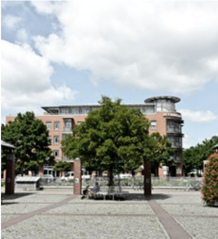
Norderstedt – Perfekt an Hamburgs Großstadtangebot angebunden und trotzdem im Grünen