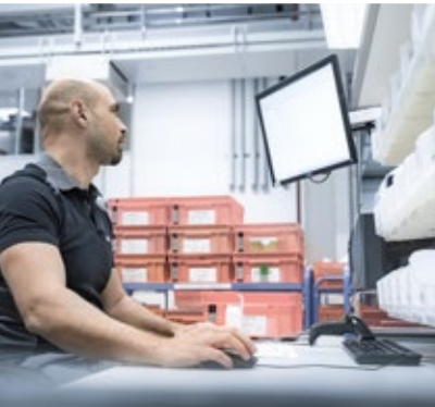
Global aufgestellt, regional verwurzelt