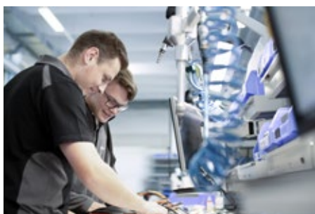
Eigene Stärken entdecken und uns als potentiellen Arbeitgeber kennenlernen