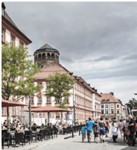
Die pulsierende Universitätsstadt Bayreuth ist regionales Zentrum mit attraktiver Lage