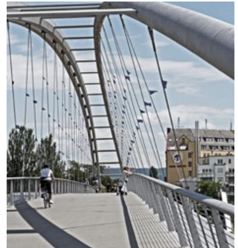
Weil am Rhein ist Kultur- und Architekturmekka mit besten Verbindungen im Drei-Länder-Eck

Das liebenswerte, beschauliche oberpfälzische Städtchen ist mit seinen gut 20.000 Einwohnern eingebettet in eine wunderschöne Umgebung. Neubürger freuen sich über erschwingliche Grundstücks- und Immobilienpreise, Naturliebhaber über ein großes Naherholungsgebiet und ein ausgedehntes Wander- und Radwegenetz im Städtedreieck Nürnberg-Bayreuth-Regensburg.