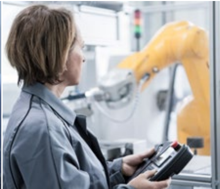
Robotics Robotiklösungen – sauber und beständig