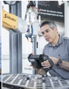
Starke Lösungen für unsere Kunden