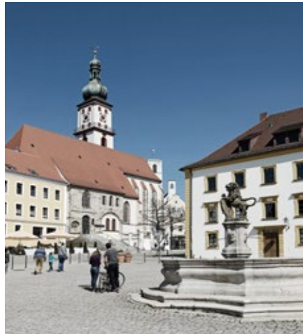
Eingebettet in wunderschöne Landschaft liegt das lebenswerte Sulzbach-Rosenberg

Norderstedt ist die viertgrößte Stadt in Schleswig-Holstein und profitiert von der unmittelbaren Randlage zu Hamburg, z. B. durch die direkte U-Bahn Anbindung. Über 80.000 Einwohner schätzen das grüne Idyll mit seinem riesigen Landschaftspark, unzähligen Sport- und Kultur-Angeboten sowie viel frischer Luft.