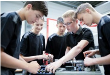
Zusammen Herausforderungen meistern und neue Erfahrungen sammeln

Wie sieht es mit den Übernahmechancen nach der Ausbildung aus? Bei Stäubli sind sie sehr gut. Das Wichtigste ist, dass man während der Ausbildung Interesse zeigt und sich engagiert. Dann sollte auch die Übernahme klappen!