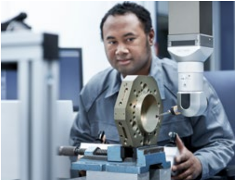
Connectors Verbindungstechnik für Sicherheit und Zuverlässigkeit