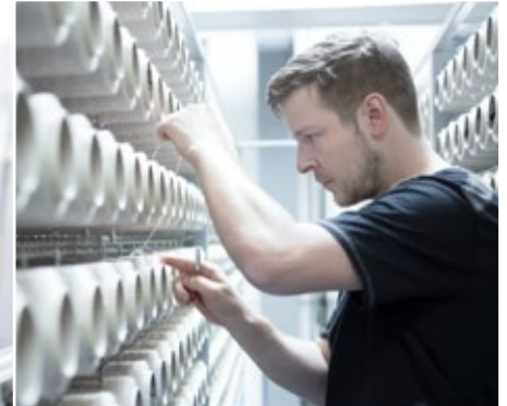
Textile Produktivitätsorientierte Technologien für Webereien