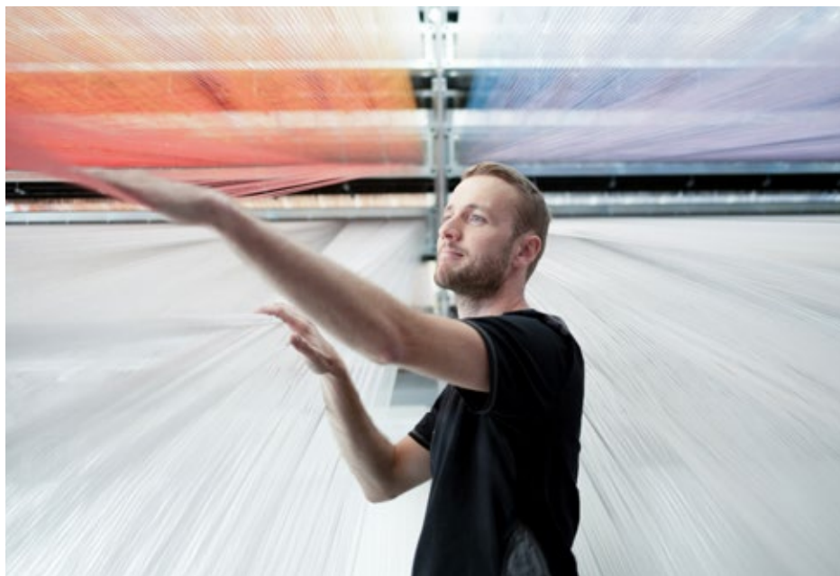
Leidenschaft für Technik ausleben und gemeinsam Herausforderungen meistern

Sie sind auf der Suche nach einer neuen beruflichen Herausforderung? Entdecken Sie unsere vielfältigen Job-Möglichkeiten und gestalten Sie gemeinsam mit uns die Zukunft von Stäubli!