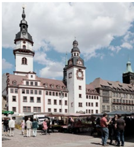
Chemnitz glänzt sowohl mit reichhaltigem Kulturangebot wie als Technologiestandort