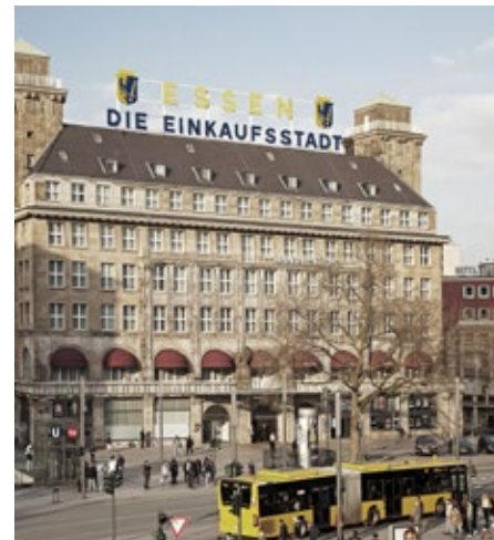
Essen bietet neben Industriegeschichte Lebensqualität und aktives Stadtleben