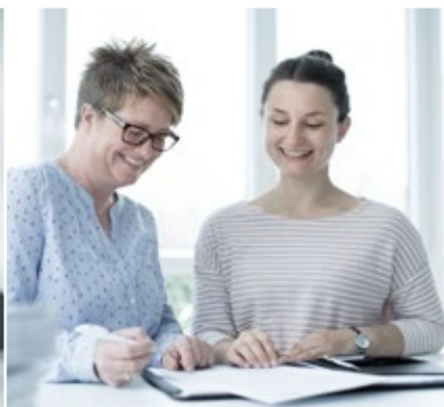
Werte und Kultur erleben