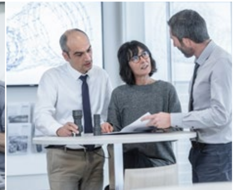
Stäubli ist international