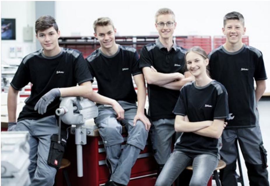
In der Ausbildung Freundschaften schließen und ein gemeinsames Ziel verfolgen