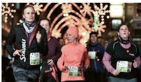
«Basel Stadtlauf» in der Schweiz

Viele unserer Standorte rund um den Globus haben PV-Anlagen installiert, darunter Allschwil und Sargans (Schweiz), Bayreuth (Deutschland), Carate (Italien), Pardubice (Tschechische Republik), Windsor (USA) und unser Hauptsitz in Pfäffikon (Schweiz). Alle PV-Anlagen sind mit unseren Original Stäubli MC4 Steckverbindern ausgestattet. Mit der Installation von PV-Anlagen wollen wir unseren Beitrag zum Umweltschutz leisten, lokalen und nachhaltigen Strom erzeugen und dadurch unseren ökologischen Fußabdruck verringern.