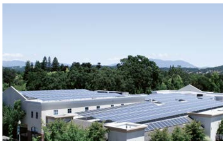
Stäubli-Standort in Windsor, USA