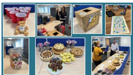
Wohltätigkeitsveranstaltung in Großbritannien

Mit einer Wohltätigkeitsveranstaltung für den «Children in Need»-Tag sammelte unser Stäubli-Standort in Großbritannien Spenden für Kinder und Jugendliche im ganzen Land.