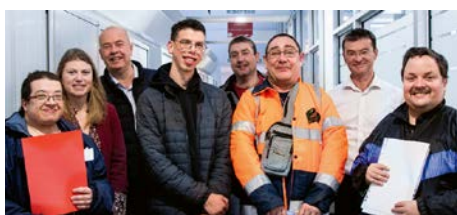
DuoDay in Faverges

Unser Forschungs- und Entwicklungsteam von Electrical Connectors nahm am Basler Stadtlauf teil, um Spenden für die Stiftung «Krebskranke Kinder Basel» zu sammeln, die kranken Kindern und ihren Familien hilft.