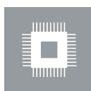
Elektronik und Kommunikation