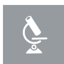
Pharmazeutika und Biotechnologie