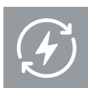
Energieübertragung und -verteilung