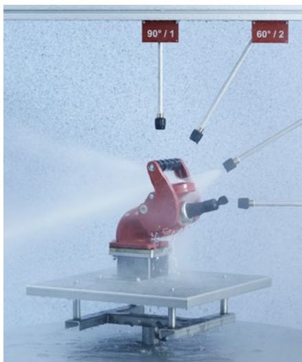
Système d'essai IP pour la protection contre les jets d'eau