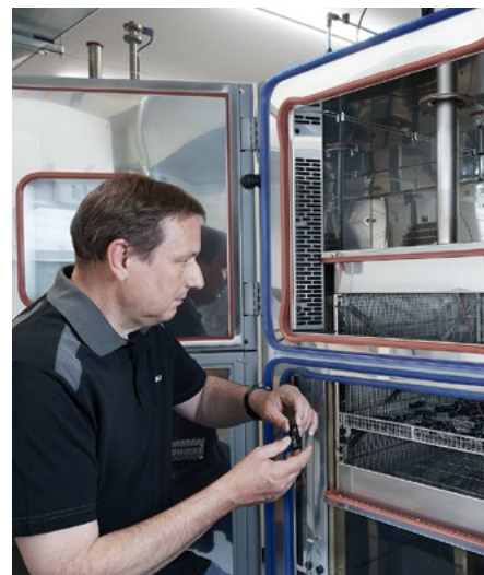
Test climatique et choc thermique