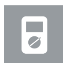
Tests et mesures